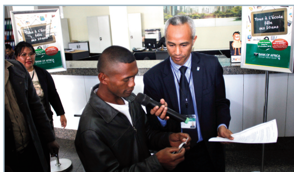
Tombola « Tous à l'École »