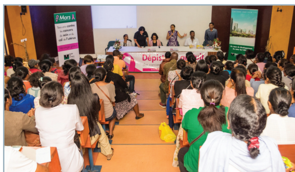
Séance de dépistage des cancers du sein et du col de l'utérus