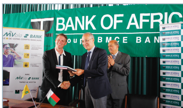
Signature d'un partenariat avec MVOLA