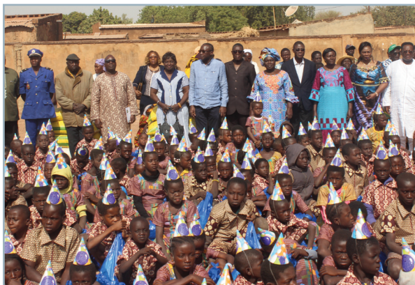
21 e édition de la Journée de la solidarité