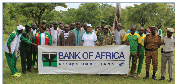
Contribution à la restauration du couvert végétal