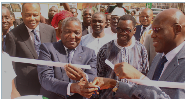
Inauguration du 2e Centre d'Affaires de Bobo Dioulasso