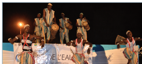
Prestation d'une troupe de danse traditionnelle