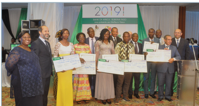
Récompense des meilleurs agents 2018