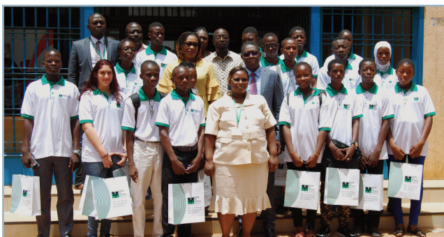
Visite des meilleurs élèves de l'année